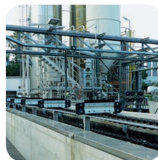
Скребок для удаления