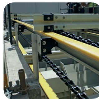
Скребок для удаления плавающих веществ с поверхности на резервуаре