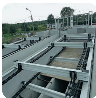
Скребок для флотации в коммунальном бассейне