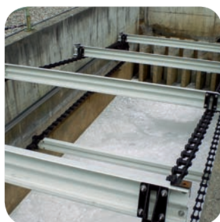
Промышленный скребок для удаления шлама