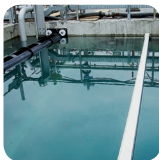
Скребок для флотации со

Скребковые системы PROBIG® соответствуют требованиям высочайших международных стандартов, проверены на соответствие требованиям Союза работников технического надзора ( TÜV ), сертифицированы по ISO 9001, ISO 14001 и OHSAS 18001.