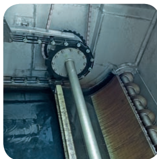
Скребок DAF: промывное отверстие с наклонной площадкой, шлам выносятся